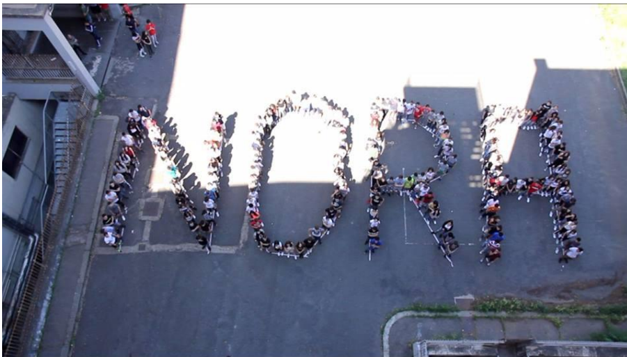
Progetto Nora al Liceo Scientifico Levi-Civita di Roma